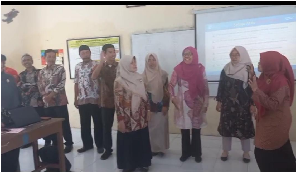
Gambar 1. Kegiatan Mulai Dari Diri

Peserta melakukan refleksi tentang langkah - langkah yang dilakukan dalam menindaklanjuti berbagai situasi di lingkungan sekolah. Dalam kegiatan ini fasilitator menampilkan kepada peserta tentang beberapa situasi yang sering terjadi di sekolah. Seperti Kepala sekolah kesulitan untuk memimpin rapat refleksi rutin mingguan karena seringkali ada kegiatan lain yang bersifat mendadak, beberapa kali orang tua datang ke sekolah marah - marah karena anaknya dipukul atau berkelahi dengan siswa lain, dana BOS belum cair selama 3 Bulan (Januari, Pebruari, Maret) dimana operasional sekolah tetap harus berjalan, dan terdapat 7 orang guru honorer di sekolah yang lolos P3K secara bersamaan dan akan bertugas di sekolah lain dalam waktu 6 bulan kedepan. Dari contoh-contoh tersebut peserta memilih salah satu situasi yang mereka akan prioritaskan untuk ditindaklanjuti serta memberi kesempatan ke beberapa peserta untuk memaparkan dasar pilihan mereka.