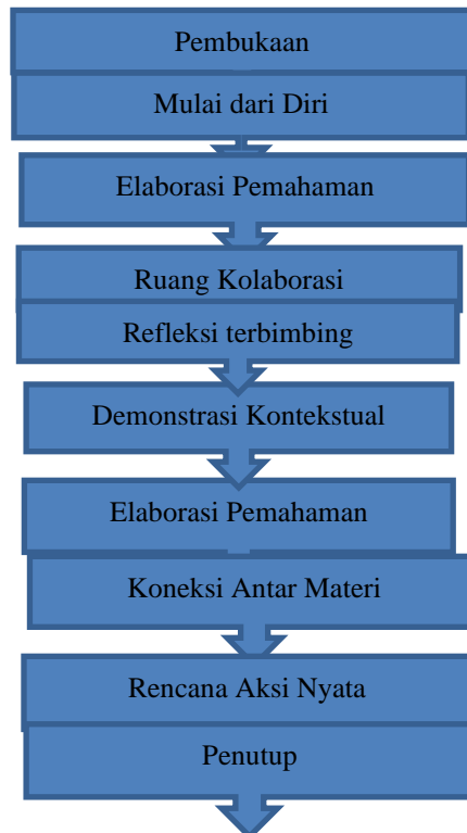
Gambar 1. Alur Tahapan Lokakarya Kepemimpinan Sekolah

melakukan perubahan dan perbaikan (Rinwanto dan Hosaini, 2021). Pihak yang terlibat dan juga bentuk keterlibatan (partnership) pada lokakarya kepemimpinan sekolah ini adalah Balai Guru Penggerak Provinsi Jawa Tengah, Fasilitator Sekolah Penggerak Angkatan 2 dan 6 Kepala sekolah dan 5 pengawas sekolah serta 12 guru di kabupaten Tegal sebagai peserta. Tempat kegiatan di SMK N 2 Slawi Kabupaten Tegal. Waktu pelaksanaan di fokuskan satu hari dengan durasi pertemuan 8 JP. Langkah-langkah kegiatan lokakarya sebagai berikut: