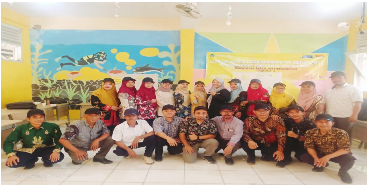
Gambar 4. Kegiatan Penutup

Kegiatan lokakarya ditutup dengan memberi apresiasi kepada peserta dan berharap bahwa apa yang sudah didiskusikan bisa menjadi bahan untuk mendampingi dan meningkatkan kompetensi kepala sekolah dan pengawas sekolah. Selain itu kegiatan lokakarya ini mampu membuat peserta terutama kepala sekolah dan pengawas mempraktikkan langkah-langkah 5T yaitu telusuri Kondisi Kunci, tentukan kondisi batasan, tetapkan kondisi Ideal, terapkan aksi nyata, temukan umpan balik