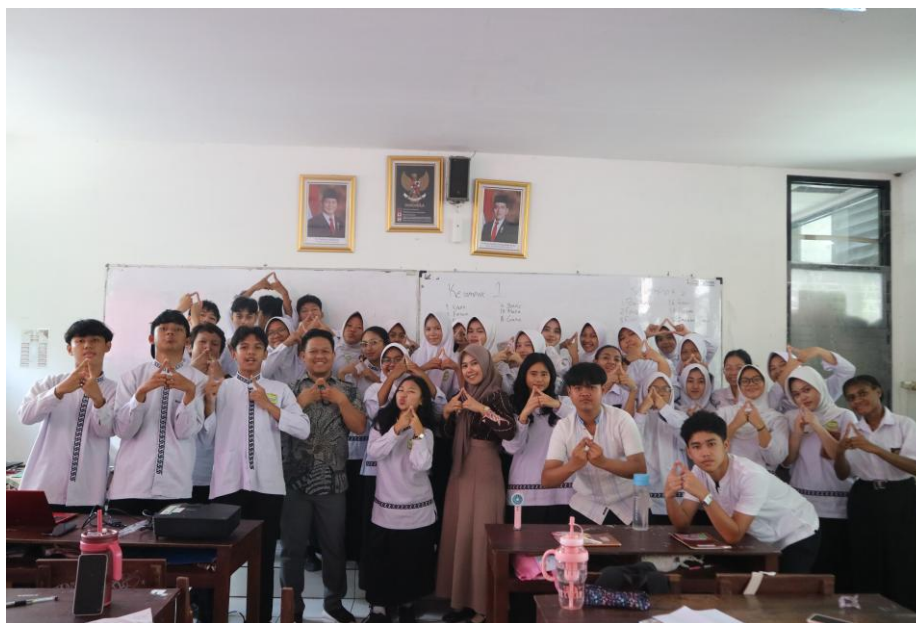
Gambar 3 Kegiatan Edukasi di Dalam Kelas