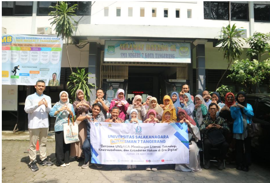
Gambar 2 Kegiatan Pelaksanaan PKM