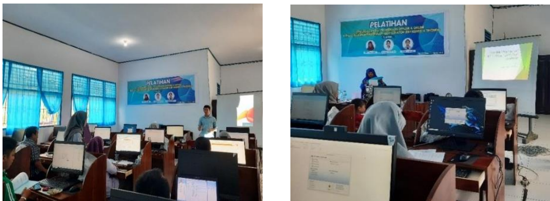
Gambar 2. Pelaksanaan pelatihan

Secara umum, hasil pelaksanaan pelatihan pembuatan soal berbasis komputer dengan menggunakan WQC di SMP Negeri 1 Tinondo disajikan dalam Tabel berikut