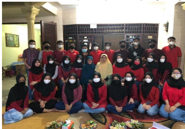
Gambar 3: Peserta Workshop Inovasi Pemasaran dan Socio Preneur

Promosi secara getok tular atau word of mouth (WOM) akan terjadi dan hal tersebut tergantung kepada produk yang di tawarkan apakah memuaskan atau mengecewakan. Promosi WOM ini merupakan promosi yang sangat ampuh dan efektif.