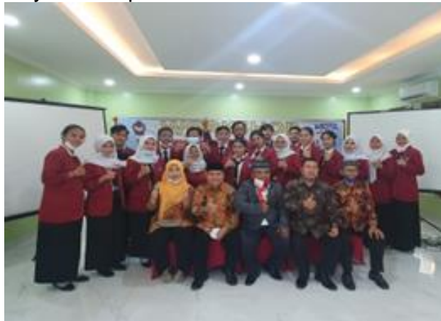
Gambar 4: Narasumber dan Peserta Workshop

Dari post test yang dilakukan setelah berakhirnya acara paparan, rata-rata peserta memahami akan pembuatan media promosi melalui instagram dan lainnya, artinya mereka mampu membuat sebuah media instagram untuk mempromosikan produk-produk yang mereka hasilkan. Dari kegiatan workshop ini diharapkan peserta dapat mengembangkannya, selanjutnya dapat menularkan ilmunya kepada calon-calon pengusaha dan terciptanya social preneur.